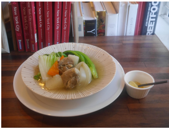
25Hudsonの#コロナのバカ飯

こうした非公開グループの活性化に向けたエンタメコンテンツを提供することで、「苦しいではなく、『楽しさ』をもってコロナショックを乗り越える」そして「コロナ後も見据えた飲食店の『長期的』な支援」の2点を実現していきます。